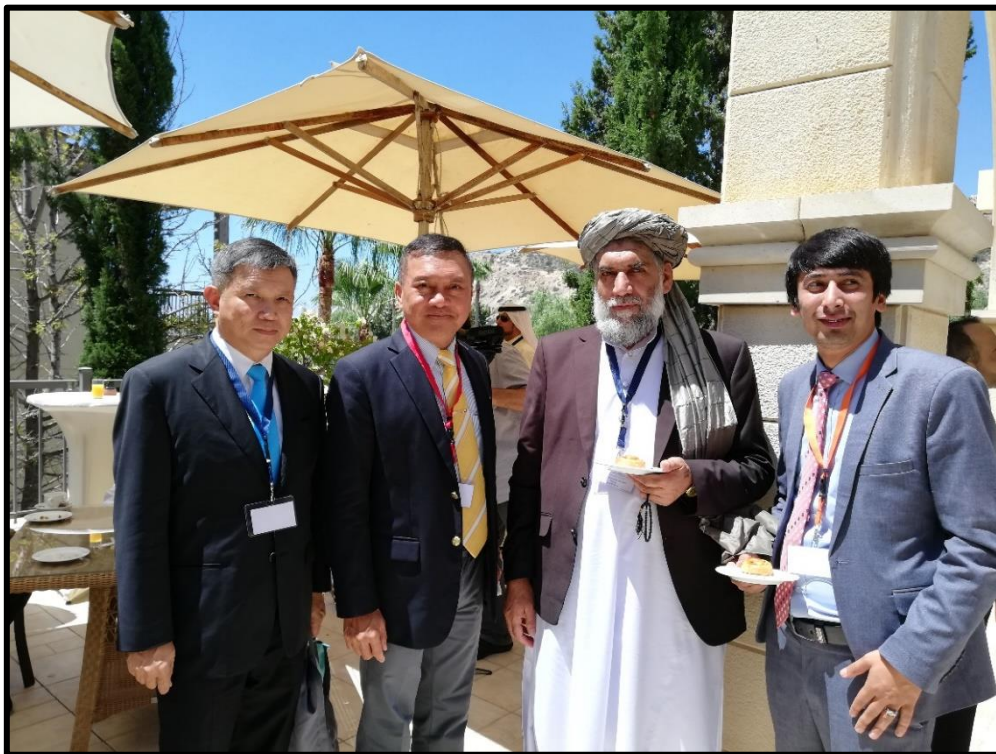
คณะผู้แทนสถานิติบัญญัติแห่งชาติพบกับผู้แทนจากสาธารณรัฐอัฟกานิสถาน