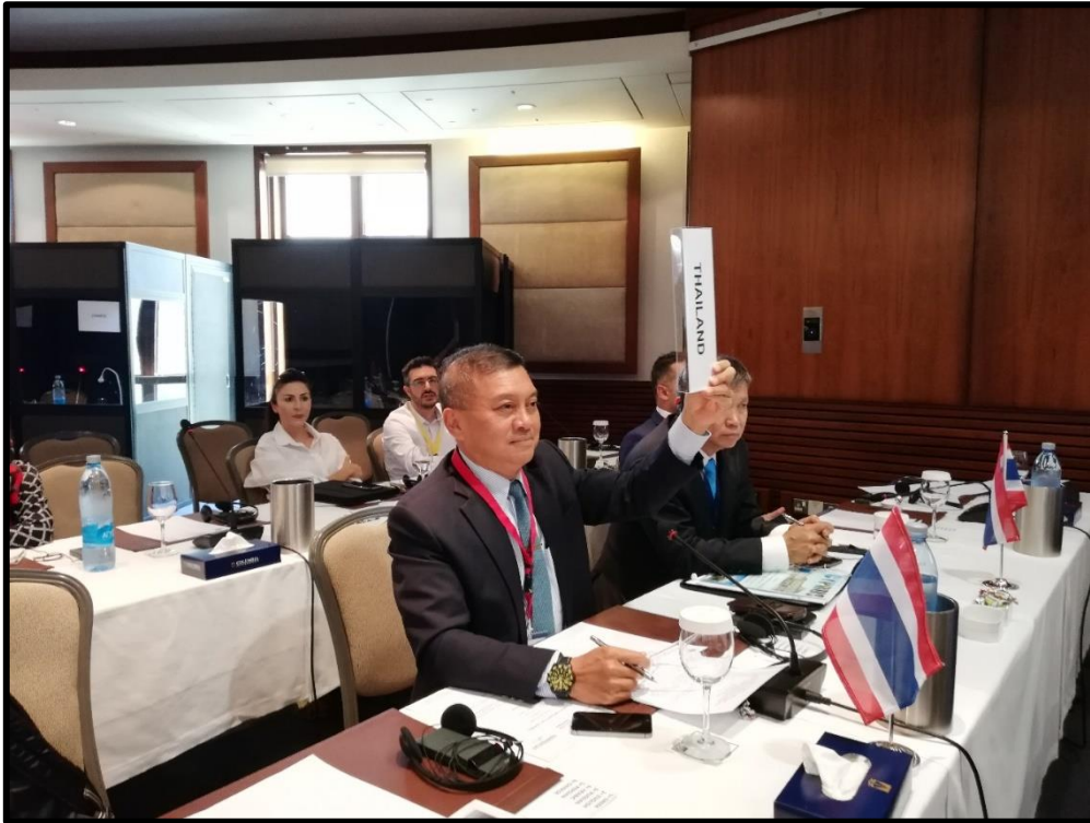
พลเอก นิพัทธ์ ทองเล็ก แสดงความจำนงขอกล่าวถ้อยแถลงระหว่างการประชุม