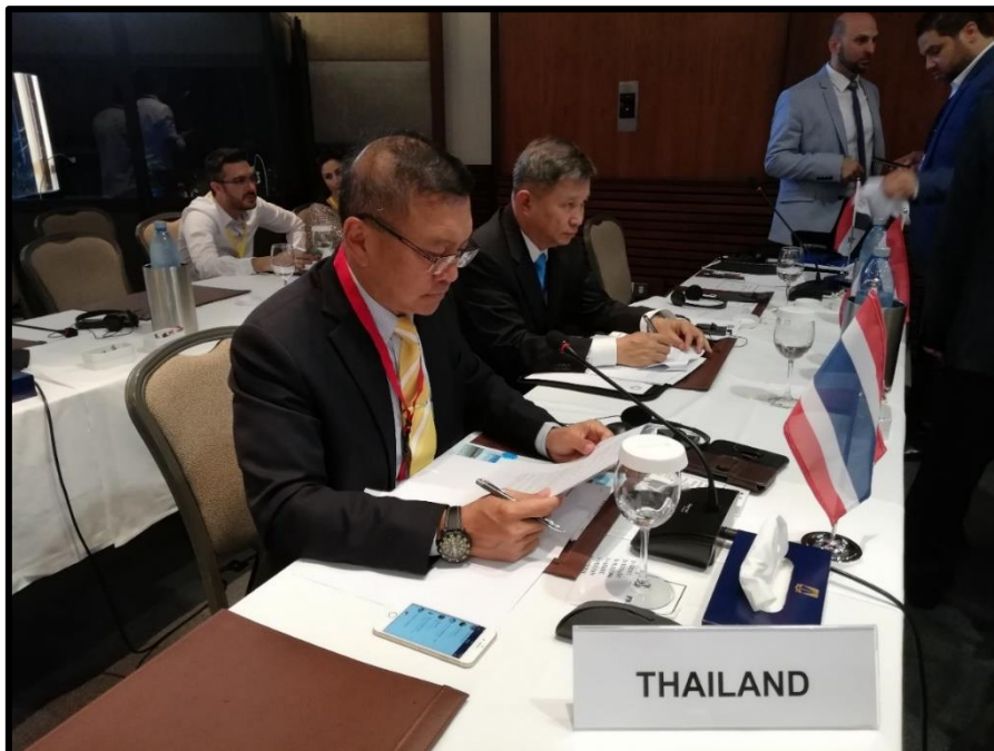
คณะผู้แทนสภานิติบัญญัติแห่งชาติ ขณะพิจารณาร่างข้อมติต่าง ๆ ที่เกี่ยวข้องกับการประชุมฯ

การดำเนินการตามเป้าหมายการพัฒนาที่ยั่งยืน (SDGs)