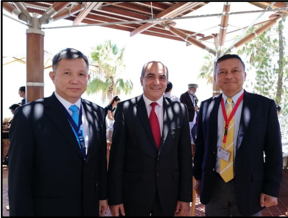
คณะผู้แทนสถานิติบัญญัติแห่งชาติพบกับนาย Demetris Syllouris ประธานสภาผู้แทนราษฎรสาธารณรัฐไซปรัส

ภาพกิจกรรมของคณะผู้แทนสถานิติบัญญัติแห่งชาติในระหว่างประชุมคณะกรรมการว่าด้วยเศรษฐกิจและการพัฒนาที่ยั่งยืนของ APA