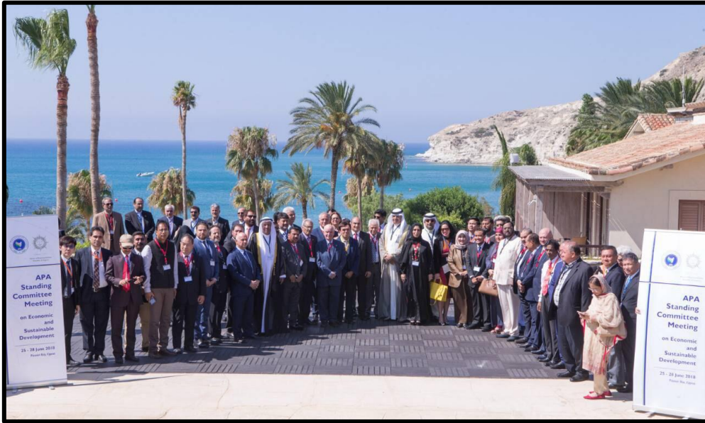
คณะผู้แทนฯ ที่เข้าร่วมการประชุมคณะกรรมการว่าด้วยเศรษฐกิจและการพัฒนาที่ยั่งยืนของ APA ถ่ายภาพร่วมกัน

จากนั้น คณะผู้แทนฯ ที่เข้าร่วมการประชุมได้มีการถ่ายภาพร่วมกันก่อนจะเริ่มการเข้าสู่การประชุม คณะกรรมการว่าด้วยเศรษฐกิจและการพัฒนาที่ยั่งยืนอย่างเป็นทางการ