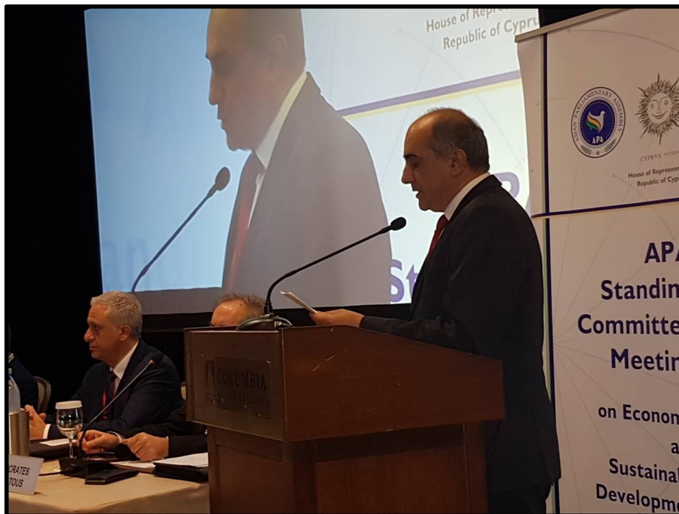
นาย Demetris Syllouris ประธานสภาผู้แทนราษฎร สาธารณรัฐไซปรัส ได้กล่าวต้อนรับ คณะผู้แทนประเทศสมาชิกต่าง ๆ ที่เข้าร่วมการประชุม