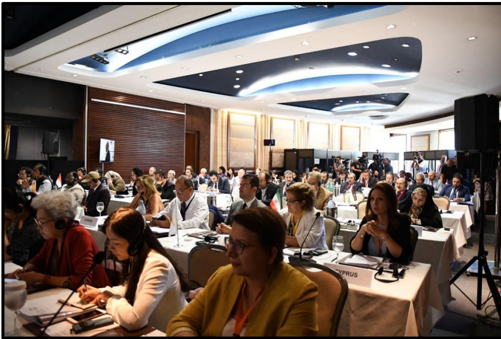
บรรยากาศพิธีเปิดการประชุม และผู้เข้าร่วมการประชุมคณะกรรมการ ว่าด้วยเศรษฐกิจและการพัฒนาที่ยั่งยืนของ APA